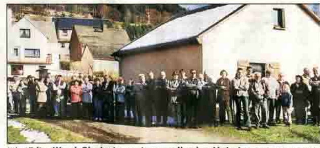
Jöhstädter Wand: Blockade vor dem anrollenden Abrissbagger.