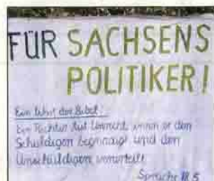
Ein deutlicher Hinweis an diejenigen, die Gesetze erlassen.